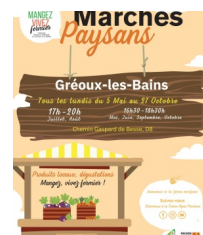
Bienvenue à la ferme