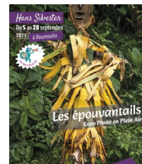
Les Arts Électik