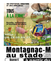
LA PETITE FERME