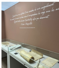
@OTC Pays de Manosque