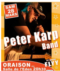
Eden district Blues