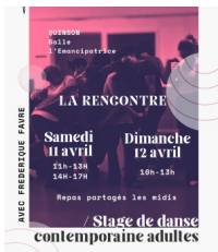
Les boukans

https://helloasso.com/les-boukans/accueil