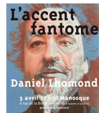
De bouche à oreilles