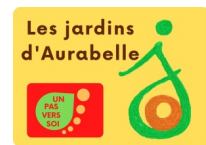
Un pas vers soi