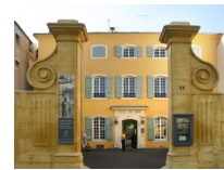
Centre Jean Giono