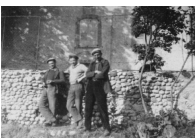
© les rendez vous de puimoisson