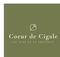
Cœur de cigale