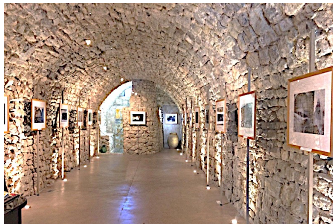
La Voûte des Arts

Tous deux sont passionnés d'art et d'histoire, ils fondent une galerie associative (la Voûte des Arts) en 2021 après la restauration en 2019-2020. L'association a déjà réalisé plus de quarante événements culturels depuis son existence et attiré 3 700 visiteurs en 2025. Les dons, adhésions et subventions permettent à la Voûte des Arts d'organiser une à deux expositions par mois. En plus d'accueillir des événements culturels et musicaux, la galerie peut également accueillir des réunions d'entreprise.